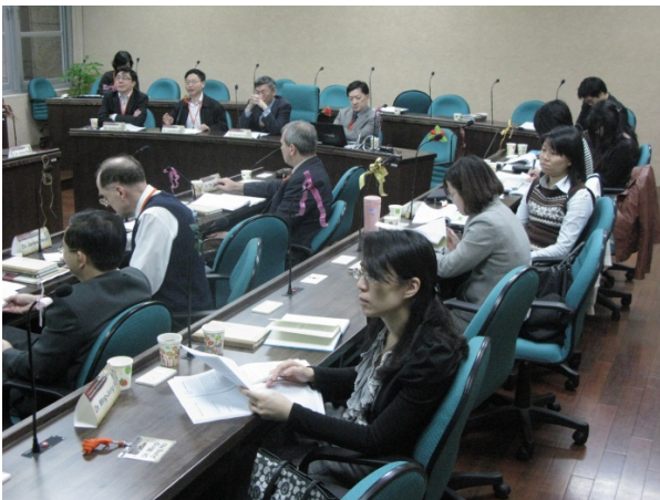
現場聽眾聽講情形